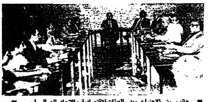
جانب من الاجتماع بين الهيئات الاقتصادية والاتحاد العمالي امس

الاجتماع المنعقد بين رؤساء الهيئات الاقتصادية وقادة الاتحاد العمالي امس، حول زيادة الاجور مساء امس، كان مصيره الفشل. وانقطع الحوار بين الطرفين بعد نقاش استمر حوالي ٢ ساعات وانسحب ممثلو الاتحاد العمالي عن الاجتماع فبدأت الهيئة الاقتصادية بالتعليقات على اجراءات الاتحاد العمالي في زيادة اجور عمالها. وقال ممثلو الاتحاد العمالي انهم لم يوافقوا على زيادة اجور عمالهم في اجتماع امس، وطلبوا من الهيئات الاقتصادية ان تتقدم بطلب الى وزارة العمل لزيادة اجور عمالها. وقال ممثلو الاتحاد العمالي انهم لم يوافقوا على زيادة اجور عمالهم في اجتماع امس، وطلبوا من الهيئات الاقتصادية ان تتقدم بطلب الى وزارة العمل لزيادة اجور عمالها. وقد طلبت جميع الهيئات الاقتصادية من الاتحاد العمالي ان يتقدم بطلب الى وزارة العمل لزيادة اجور عمالها. وقال ممثلو الاتحاد العمالي انهم لم يوافقوا على زيادة اجور عمالهم في اجتماع امس، وطلبوا من الهيئات الاقتصادية ان تتقدم بطلب الى وزارة العمل لزيادة اجور عمالها. وقد طلبت جميع الهيئات الاقتصادية من الاتحاد العمالي ان يتقدم بطلب الى وزارة العمل لزيادة اجور عمالها. وقال ممثلو الاتحاد العمالي انهم لم يوافقوا على زيادة اجور عمالهم في اجتماع امس، وطلبوا من الهيئات الاقتصادية ان تتقدم بطلب الى وزارة العمل لزيادة اجور عمالها.